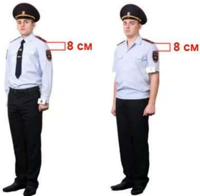
Летняя повседневная форма одежды в рубашке с длинными рукавами