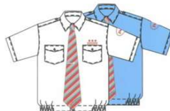
Сорочка с коротким рукавом (белая, голубая, галстук, зажим)