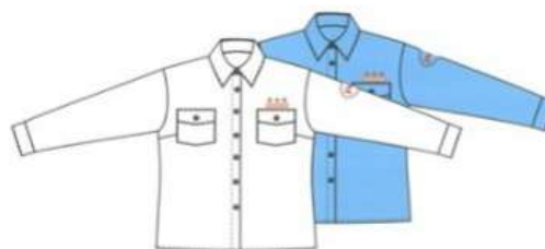
Блузка с длинным рукавом (белая, голубая)

Шеврон 75X53 мм, цвет белый, серый и месторасположение на рукаве