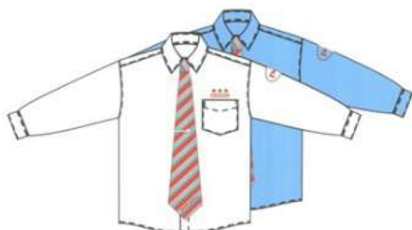
Сорочка с длинным рукавом (белая, голубая, галстук, зажим)