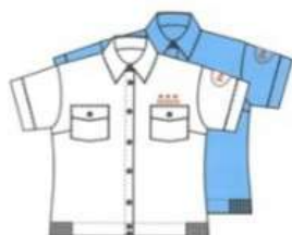
Блузка с коротким рукавом (белая, голубая)